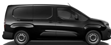
Sort Perla Nera (Metallak)