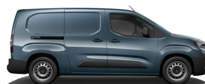
Blå Libeccio (Metallak)