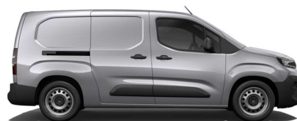
Grå Artense (Metallak)