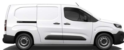
Hvid Icy (Std. lak)