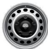
16" stålfælg med navkapsel, standard