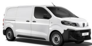
Hvid Icy (POPR), Standardlak