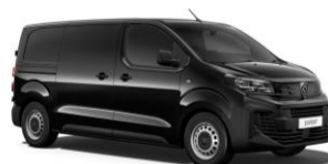
Sort Perla Nera (M09V), Metallak