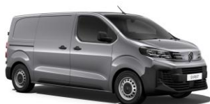
Sølvgrå Artense (M0F4), Metallak