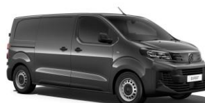
Grå Titane (M01J), Metallak