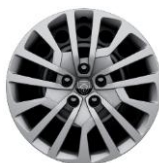
Look Pack: 17" stålfælg med hjulkapsel