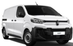
Hvid Icy (POPR), Standardlak