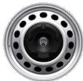
16" stålfælg med navkapsel, standard