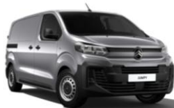
Sølvgrå Artense (M0F4), Metallak