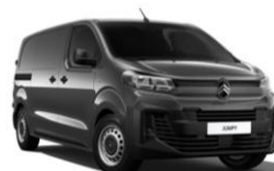
Grå Titane (M01J), Metallak