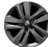
17" grå Alufælg