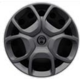
Look Pack: 17" stålfælg med hjulkapsel