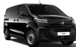
Sort Perla Nera (M09V), Metallak