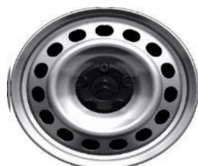
16" stålfælg med navkapsel